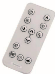
Den trådløse fjernbetjening styrer alle funktioner.